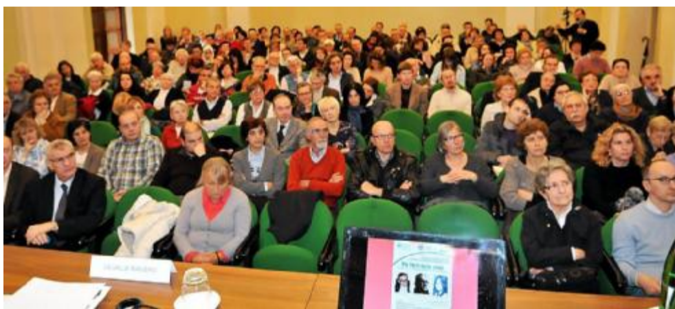
Un momento dell'incontro in cui si sono ricordati i Martiri della pace e il loro sacrificio