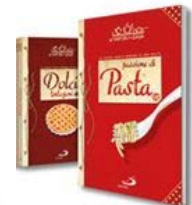
SAPORI DI CASA - 14 VOLUMI

Home | Abbonamento a Famiglia Cristiana | Privacy | Pubblicità | Redazione | Contatti