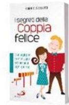
I SEGRETI DELLA COPPIA FELICE