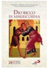
DIO RICCO DI MISERICORDIA