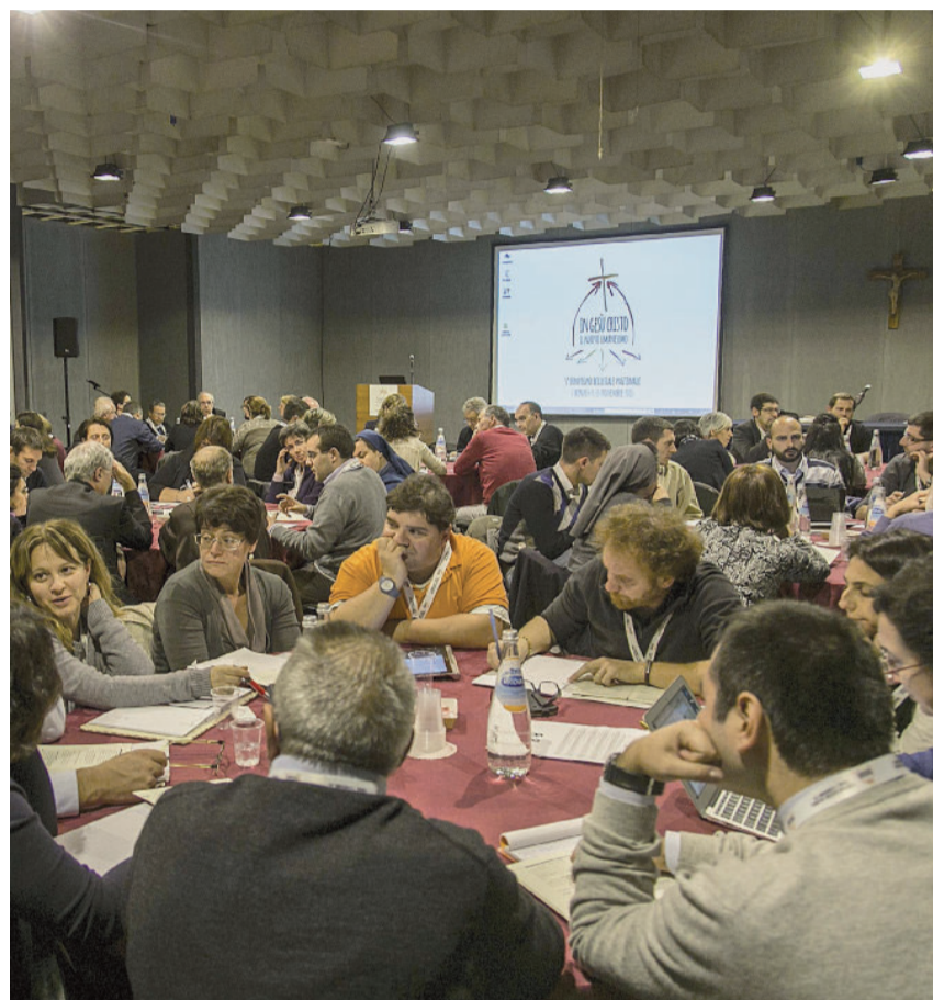
FIRENZE. I gruppi di lavoro al V Convegno ecclesiale nazionale

La tentazione gnostica. Una seconda tentazione da sconfiggere è quella dello gnosticismo. Quella gnostica non è una teoria ben definita; si tratta piuttosto di una galassia di tesi e pensieri sulla divinità e sulla via per ritornare al divino. Pur nella varietà delle teorie, lo gnosticismo presenta alcuni caratteri di base: la sfiducia nell'uomo e nel carneale; la conoscenza quale via maestra per la salvezza; la tendenza a una chiusura individualistica. Lo gnosticismo, i cui effetti anche oggi ci possono far deviare dalla via del Vangelo, «porta – nota il Papa – a confidare nel ragionamento logico e chiaro, il quale però perde la tenerezza della carne del fratello». Il suo fascino, quindi, è quello di «una fede rinchiusa nel soggettivismo, dove interessa unicamente una determinata esperienza o una serie di ragionamenti e conoscenze che si ritiene possano confortare e illuminare, ma dove il soggetto in definitiva rimane chiuso nell'immanenza della sua propria ragione o dei suoi sen-