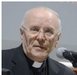
Il segretario Cei Galantino

Il nuovo umanesimo che cerchiamo non si trova in un libro; non aspettiamo che un autore ci fornisca, con una pubblicazione, una visione antropologica innovativa e adeguata al nostro tempo, peraltro in perpetua e rapida trasformazione. Vivremo e contribuiremo a diffondere un nuovo umanesimo camminando insieme alle persone, a contatto con la storia e nel riferimento costante alla persona e all'esempio di Cristo. È questa la strada che ci permette di contribuire a costruire un'umanità nuova, che riconosca e sposi la logica delle Beatitudini, facendo della ricerca della santità la via per la felicità.